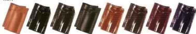
Naturröd Kol svart Blank svart Matt svart Ljus brun Mörk brun Vinnröd Lila